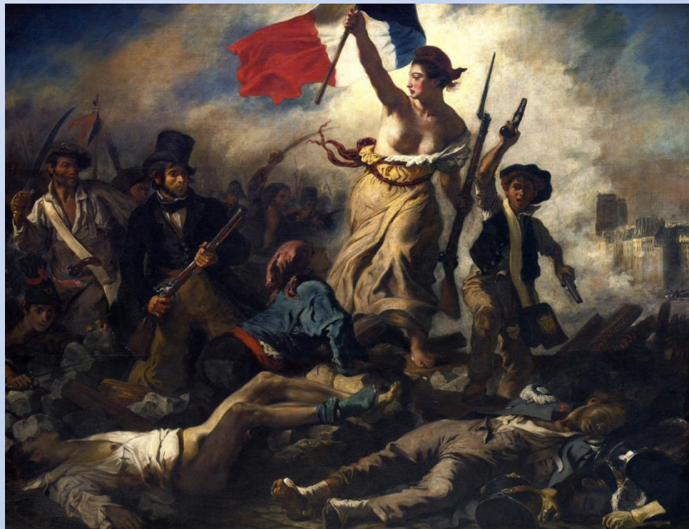
Delacroix, A liberdade guiando o povo , 1830

SURGE O MOVIMENTO REVOLUCIONÁRIO DE GOMES FREIRE D'ANDRADE (1817)