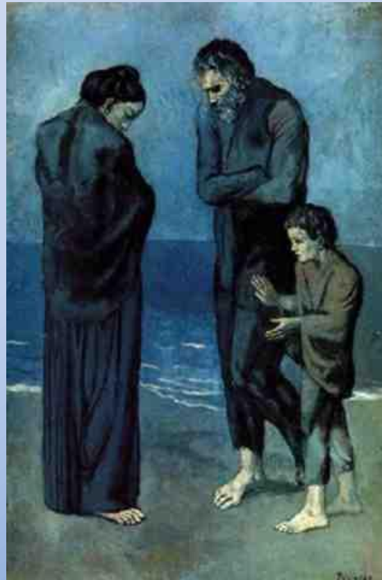
Pablo Picasso, Pobres à beira-mar , 1903