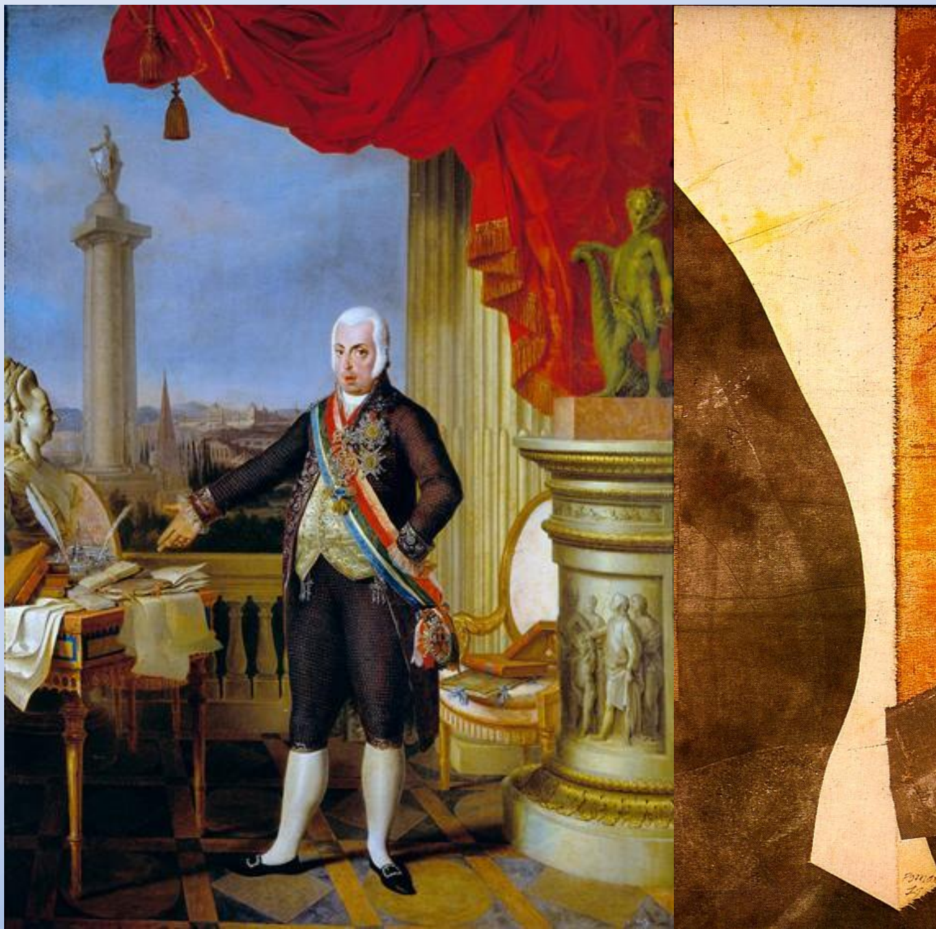
Domingos António de Sequeira, D. João V , 1818-1826