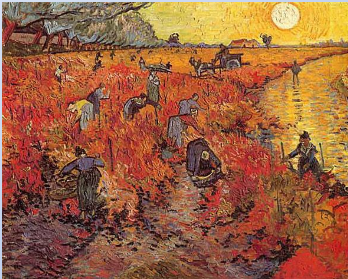
Van Gogh, A vinha encarnada , 1888