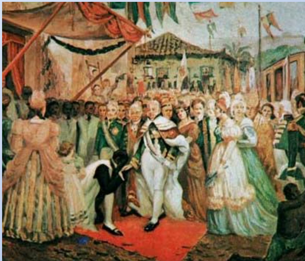
D. João VI no Rio de Janeiro

DISTÂNCIA ENTRE O CENTRO DO PODER POLÍTICO E O REI